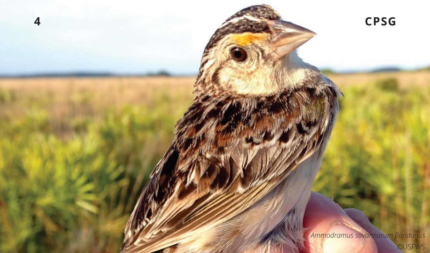
Ammodramus savannarum floridanus