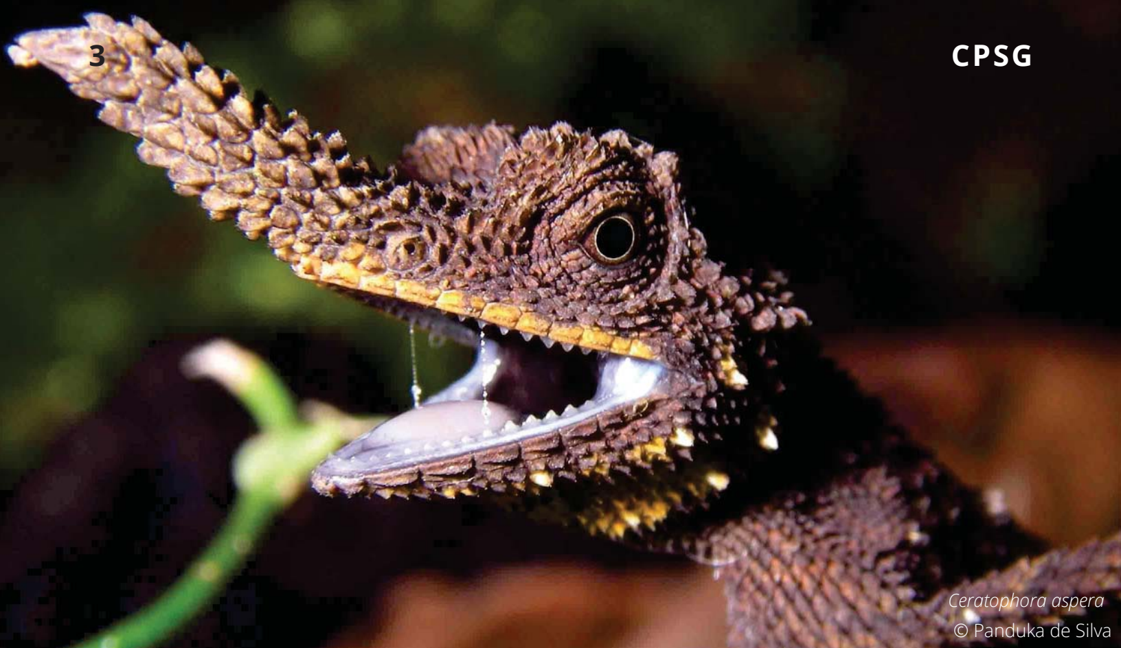
Ceratophora aspera © Panduka de Silva