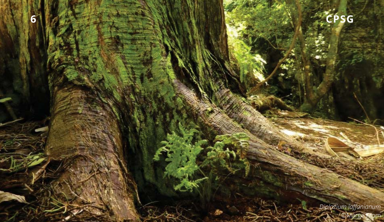
Diplazium laffanianum